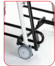
Um das Hinsetzen und Aufstehen zu erleichtern, sind die Arm- und Fußstützen hochklappbar.